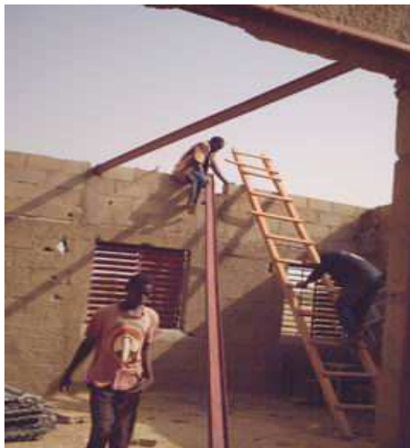
Het begin van de bouw