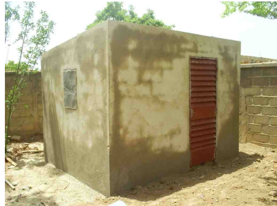
Het nieuwe keukengebouw